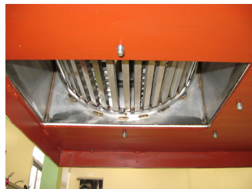
下から見た出口(標準)